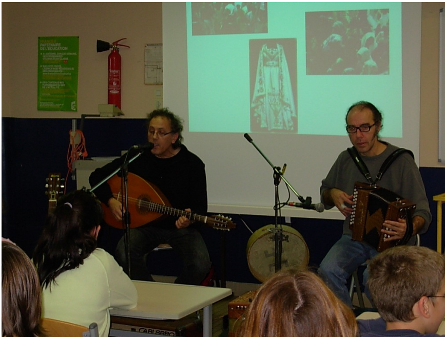
Et enfin, la musique et le chant s'imposent...