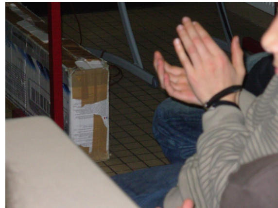
Les esprits se libèrent, les mains se libèrent...