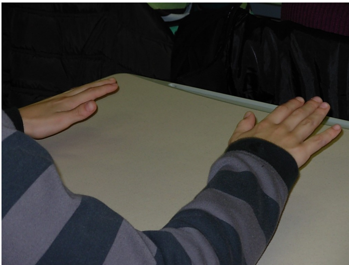
Quel est le rapport entre la musique et la calligraphie ???